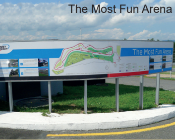
The Most Fun Arena