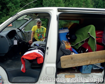
Claudio, ready to go