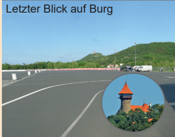
Letzter Blick auf Burg