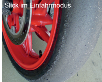
Slick im Einfahrmodus