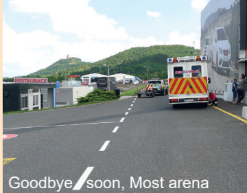
Goodbye, soon, Most arena