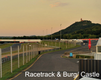
Racetrack & Burg/ Castle