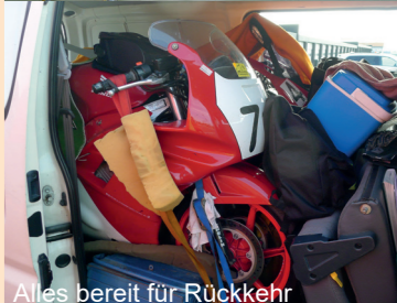
Alles bereit für Rückkehr