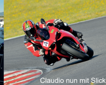
Claudio nun mit Slicks