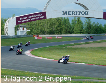
3. Tag noch 2 Gruppen