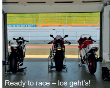
Ready to race – los geht's!