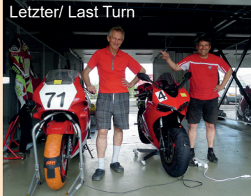
Letzter/ Last Turn