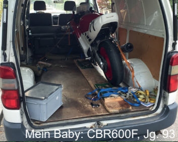
Mein Baby: CBR600F, Jg. 93