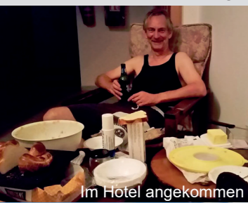
Im Hotel angekommen