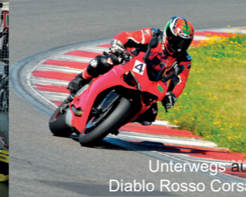
Unterwegs auf Diablo Rosso Corsa