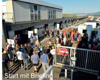
Start mit Briefing